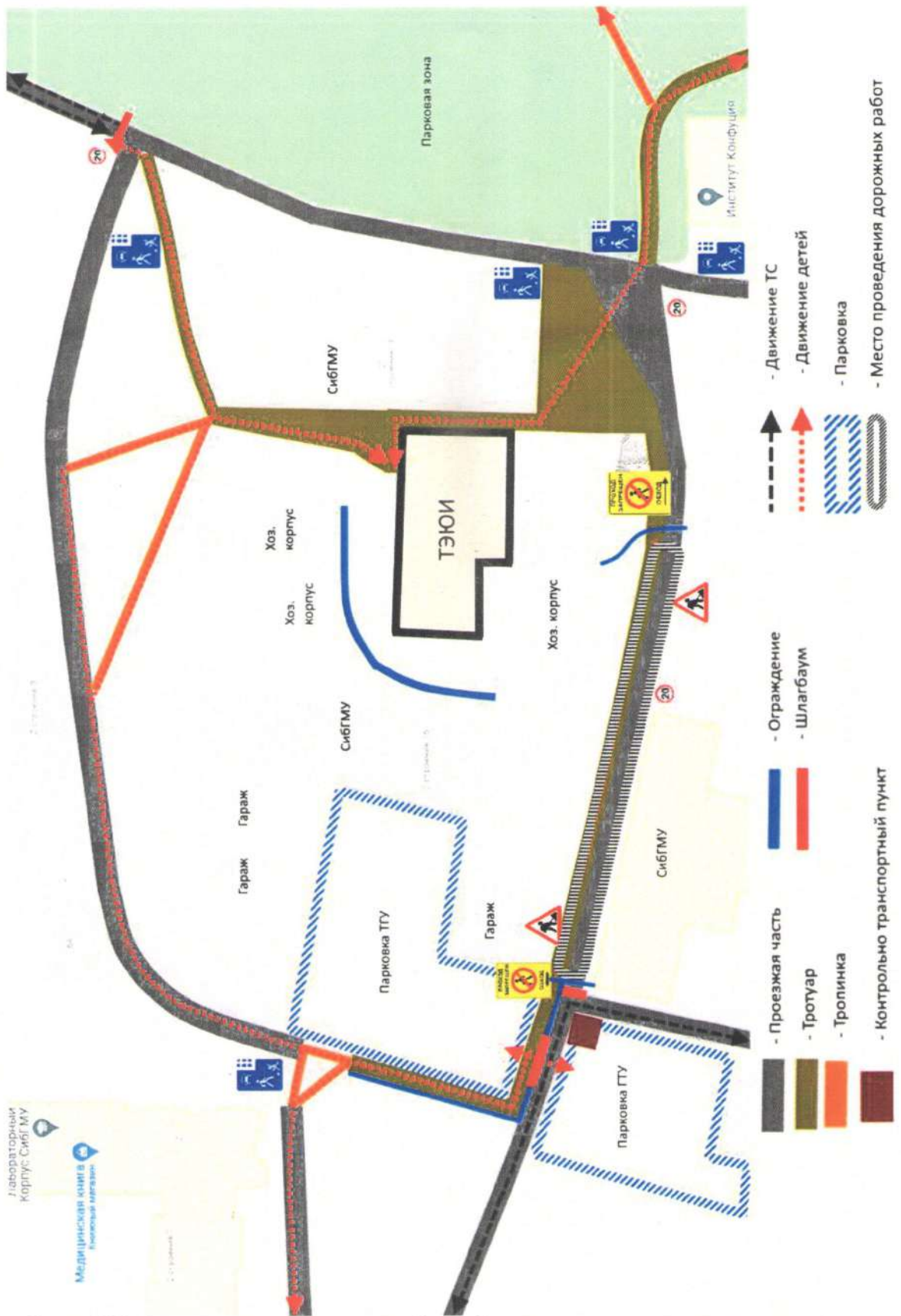
Схема №5. Организация движения детей по обходным путям при проведении дорожно-ремонтных работ.