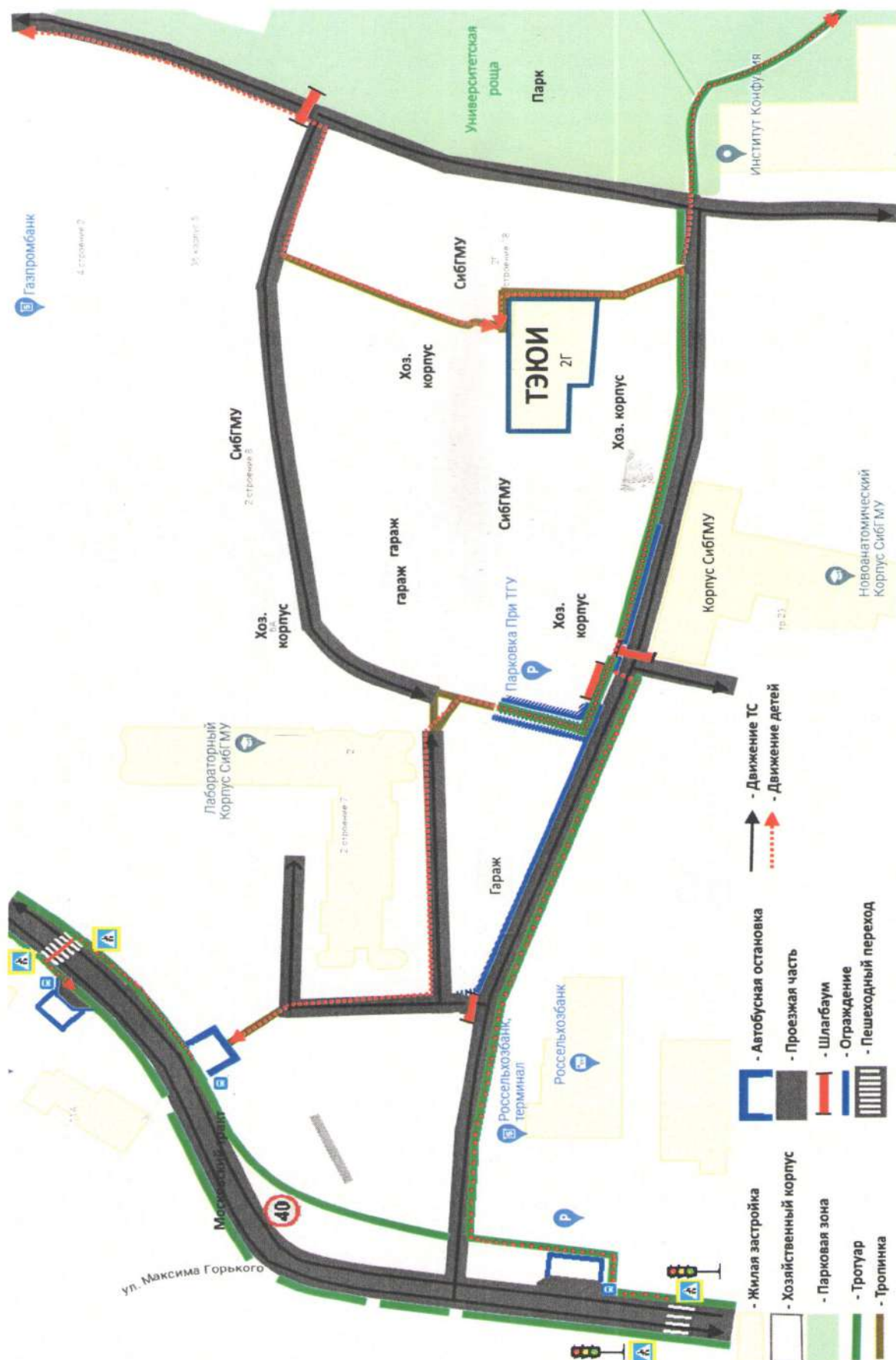
Схема №1 Район расположения образовательного учреждения, пути движения ТС и детей (обучающихся)