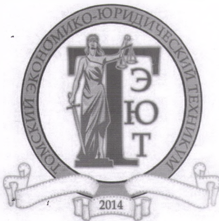
Рисунок 1 – Эмблема АНПОО «Томский экономико – юридический техникум»